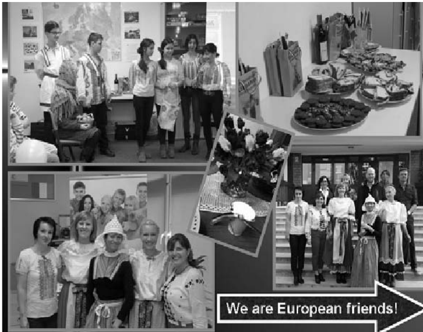
We are European friends!

* 12 PROFESORI cu competențe profesionale îmbogățite, de utilizare a metodelor de învățare personalizate, inclusiv referitoare la: dobândirea de cunoștințe despre noile pedagogii, despre aplicarea diverselor strategii didactice (prin schimb de idei, compararea curriculumurilor și planificarea în comun a unor lecții) și despre utilizarea inovativă a TIC în cadrul lecțiilor; competențe îmbunătățite de comunicare în limba engleză; abilități digitale; învățarea prin colaborare cu scopul de a crea resurse educaționale deschise; abilități crescute de lucru în echipă (inclusiv predarea în echipă) și gândire critică și reflexivă; un sentiment crescut de apartenență la spațiul european; abilități de viață dezvoltate; proces îmbunătățit de învățare pe tot par-