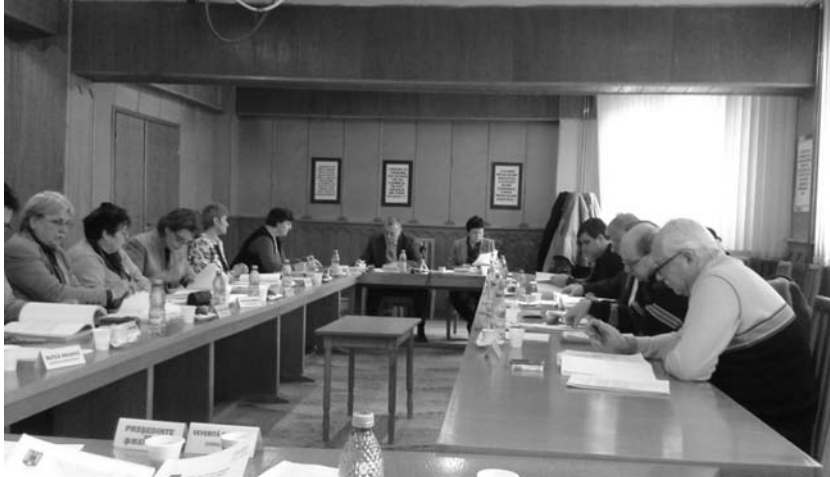
oraș Pucioasa, str. Morilor nr. 7, format din: clădire administrativă - 3 camere + grup sanitar + hol, atribuit prin contractul de împrumut de folosință nr. 16998/12.08.2014 Consiliului Local al orașului Pucioasa de către Direcția pentru Agricultură Dâmbovița.

Privind: Acordul Consiliului Local al orașului Pucioasa privind darea în folosință gratuită către SC SCUP SRL a imobilului situat în